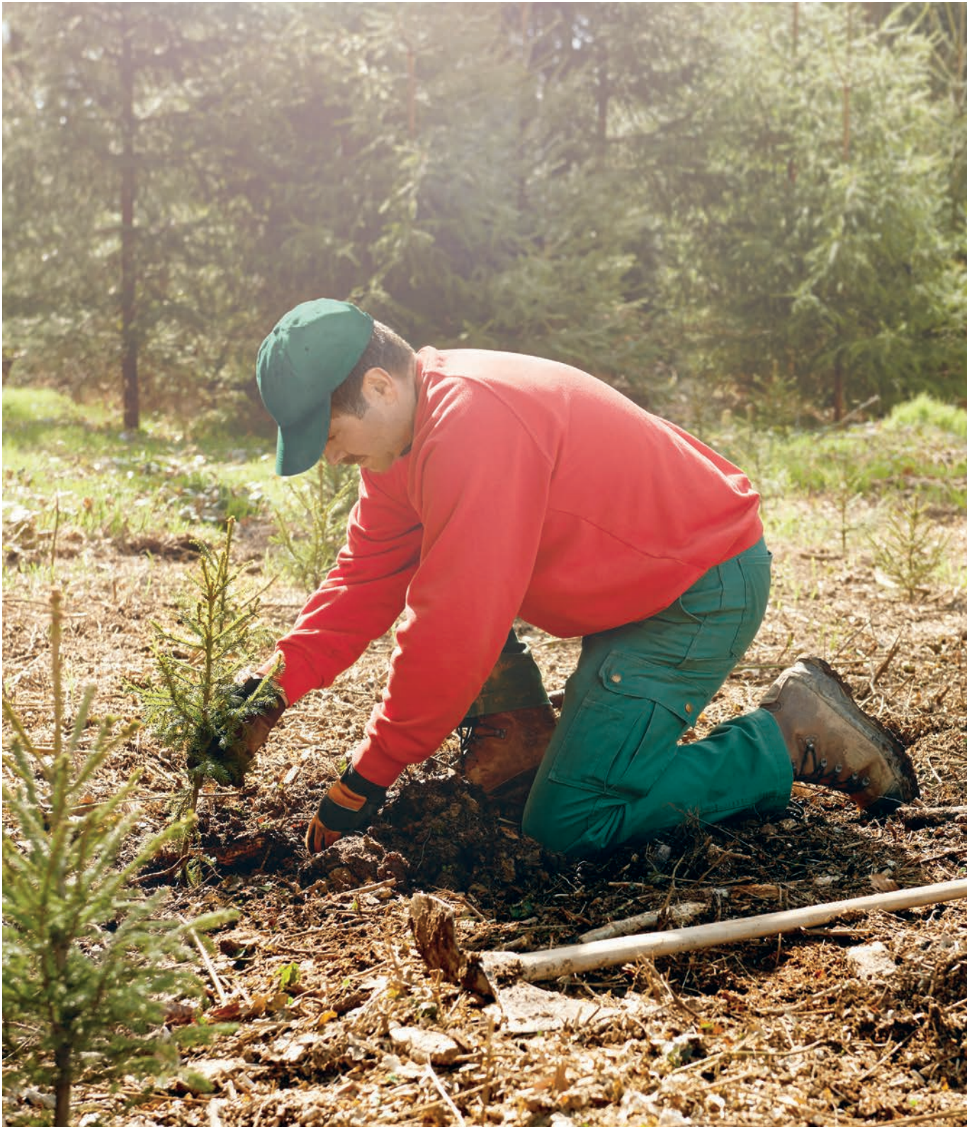
Natürliche Rohstoffe sind erneuerbare Rohstoffe. Hüsler Nest denkt in Kreisläufen.